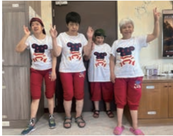
06/20 • 白蛇笑傳 - 歡慶端午活動