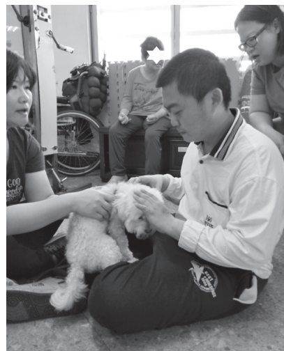
《陪伴犬專欄》 文 | 編輯部